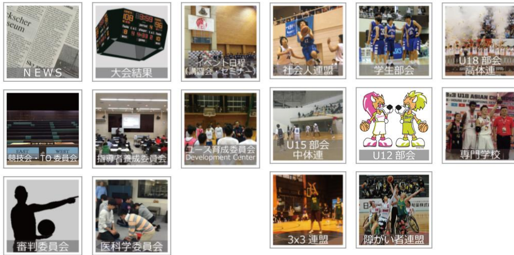
一般財団法人大阪府バスケットボール協会 公式ホームページ 2019年度-2020年度 ヒット数、ページビューの集計表